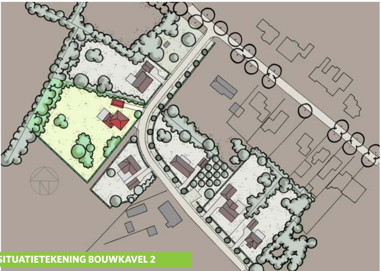
SITUATIETEKENING BOUWKAVEL 2