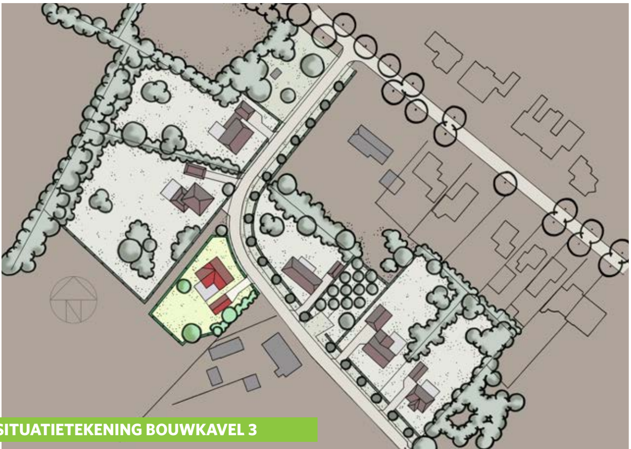
SITUATIETEKENING BOUWKAVEL 3