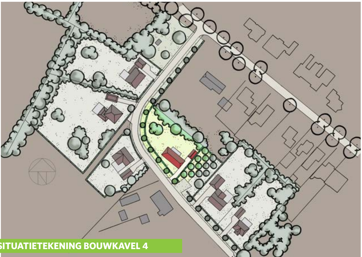
SITUATIETEKENING BOUWKAVEL 4